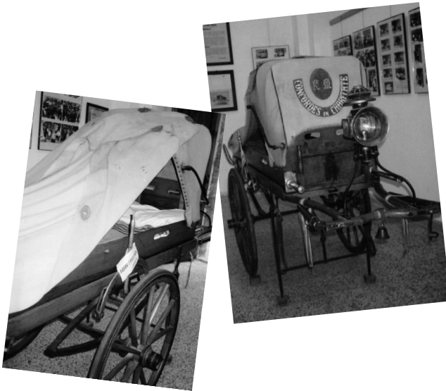
Krankentransport im Jahr 1850